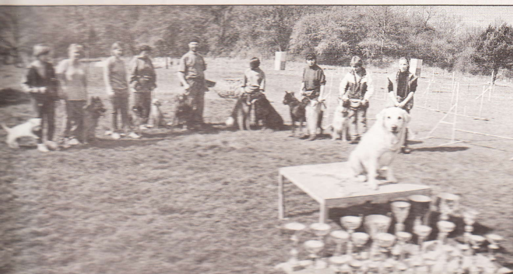
Le terrain du Fort Condé, les membres du club Givet sport et cynotechnie ont honoré Schwepps.

Renseignements au 03.24.42.31.82 ou 06.85.87.77